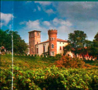
CASTELLO DI BUTTRIO